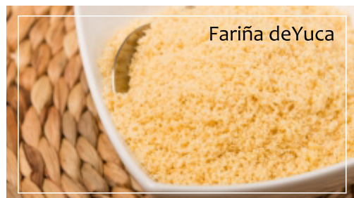
Fariña de Yuca

Frutas y productos Regionales que usamos para la elaboración de algunos platos de nuestra carta.