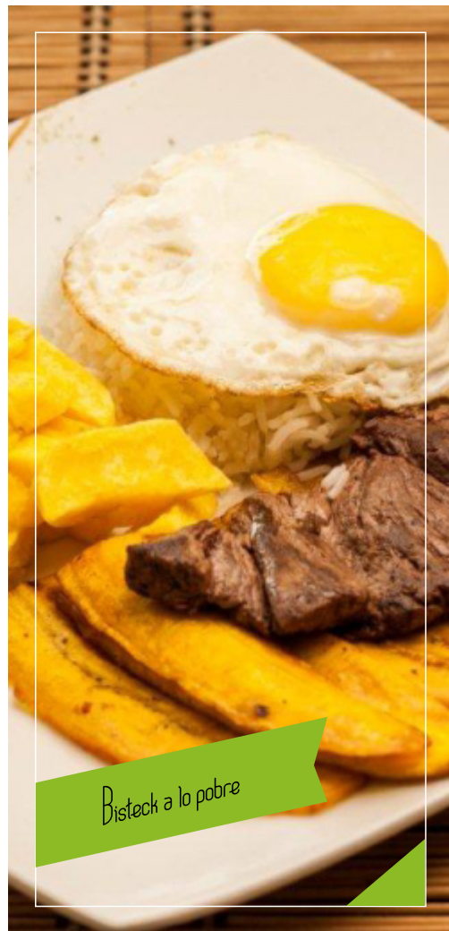
Bistec a lo pobre

Frutas y productos Regionales que usamos para la elaboración de algunos platos de nuestra carta.