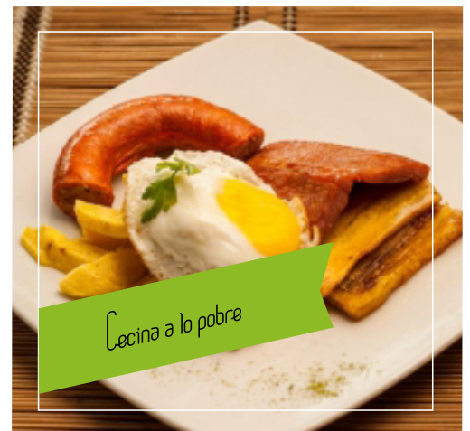
Cecina a lo pobre